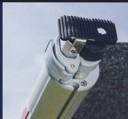
De luifelstokken schuiven in de rol-as