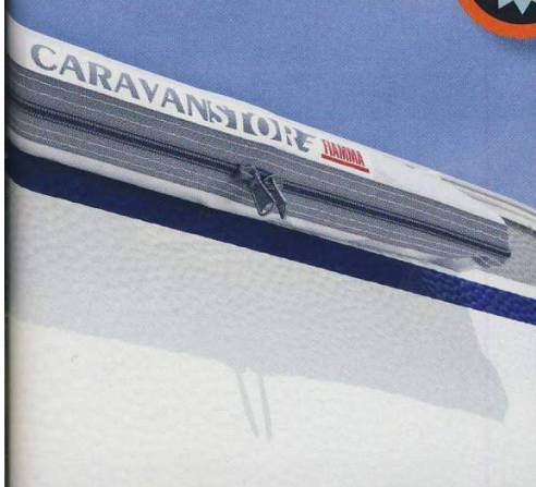
De etuiluifel vormt één geheel met de caravanwand